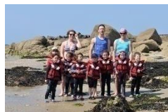
Jardin de la voile