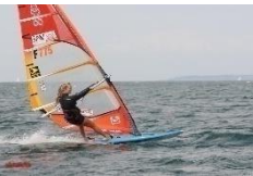
Planche à voile