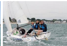
Quillard de sport